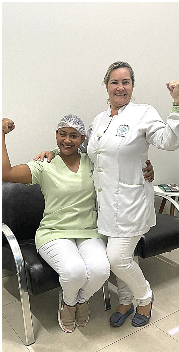
Profissionais da clínica Kurativa Clínica de Prevenção e Tratamento de Feridas de Dourados

Assim como Jaraguari-MS, as prefeituras de Bela Vista-MS e Amambai-MS e mais uma clínica particular de Dourados-MS implementaram na folha de pagamento dos profissionais da enfermagem a lei 14.434/2022 do piso salarial.